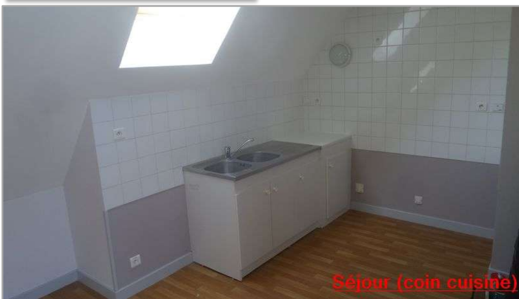
Séjour (coin cuisine)