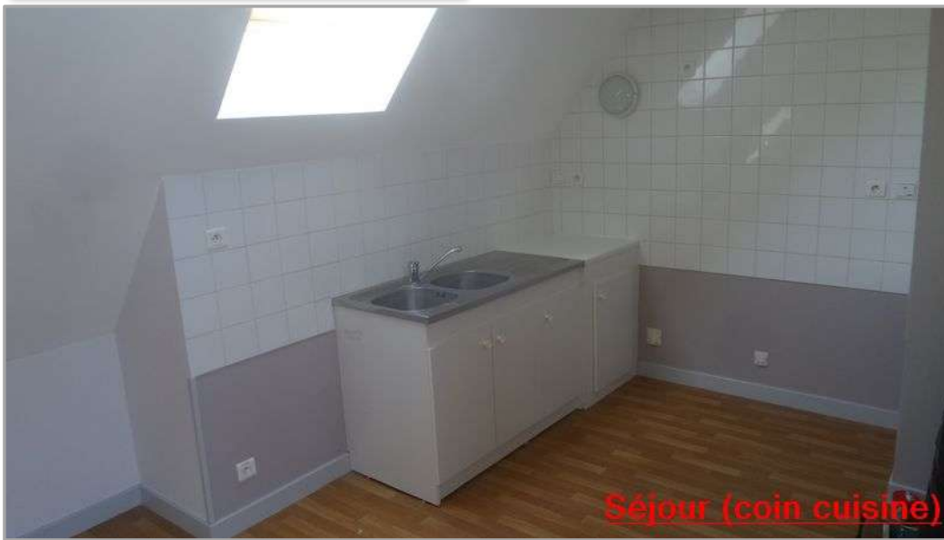
Séjour (coin cuisine)